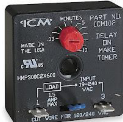
Imagen de referencia3

Grado de protección: IP40 Envoltente, IP50 Panel.